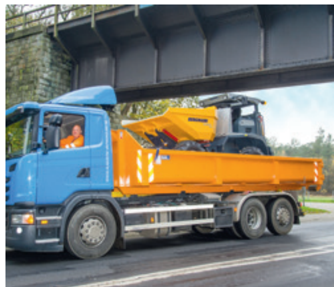
2060 plus Rundkipper