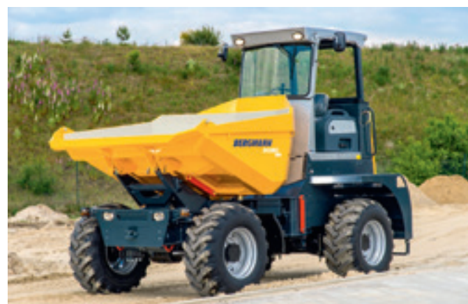
2090 plus Rundkipper